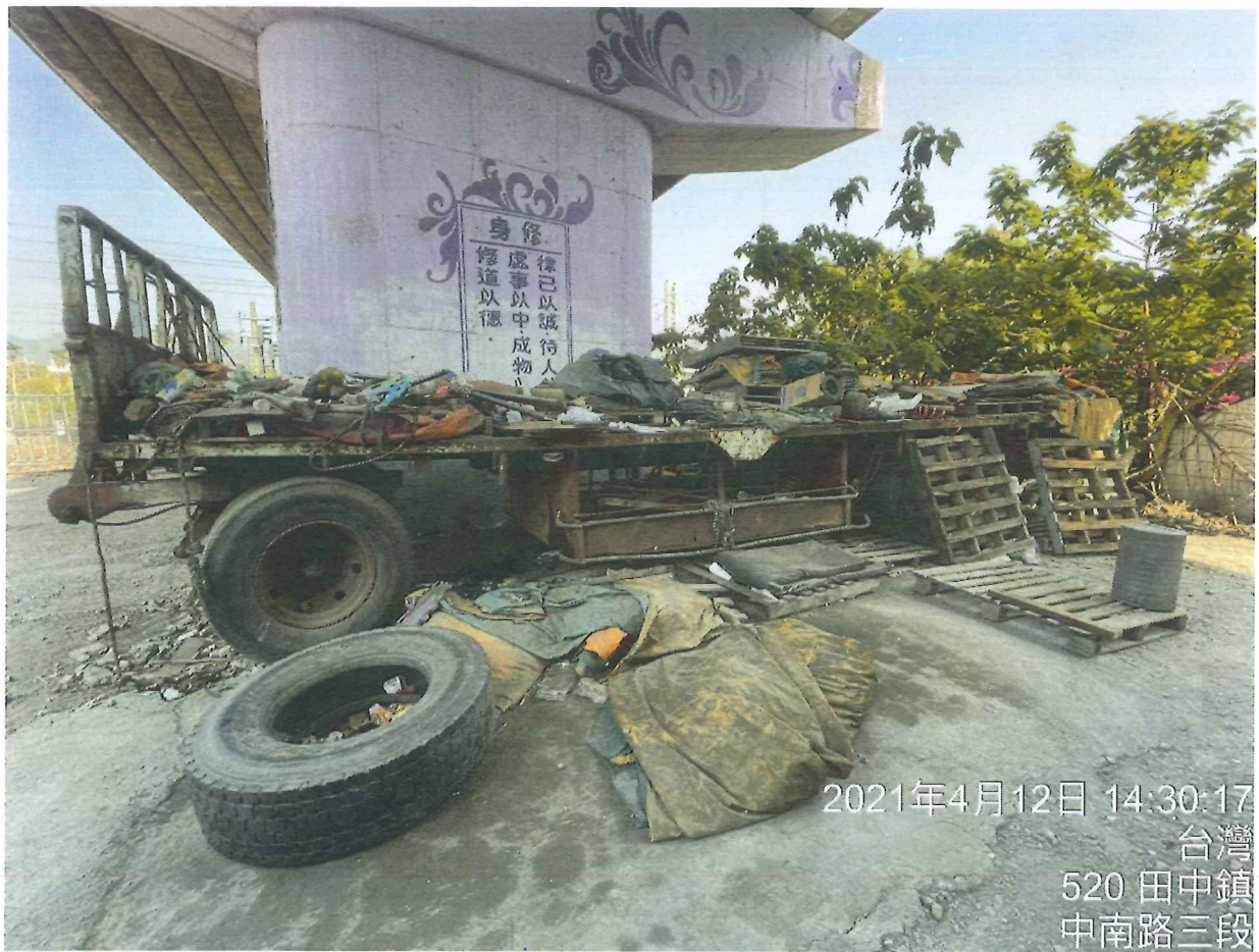
110. 4. 12 稽查照片